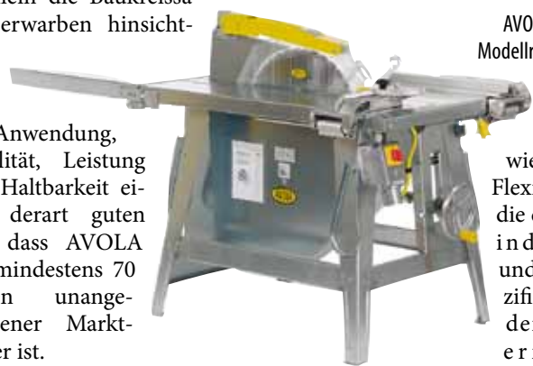
AVOLA-Baukreissäge, Modellreihe ZBV 500-10.

lich Anwendung, Stabilität, Leistung und Haltbarkeit einen derart guten Ruf, dass AVOLA seit mindestens 70 Jahren unangefochtener Marktführer ist.