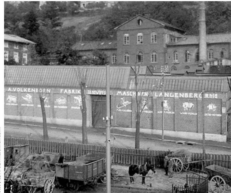
AVOLA – erstes Firmengebäude.