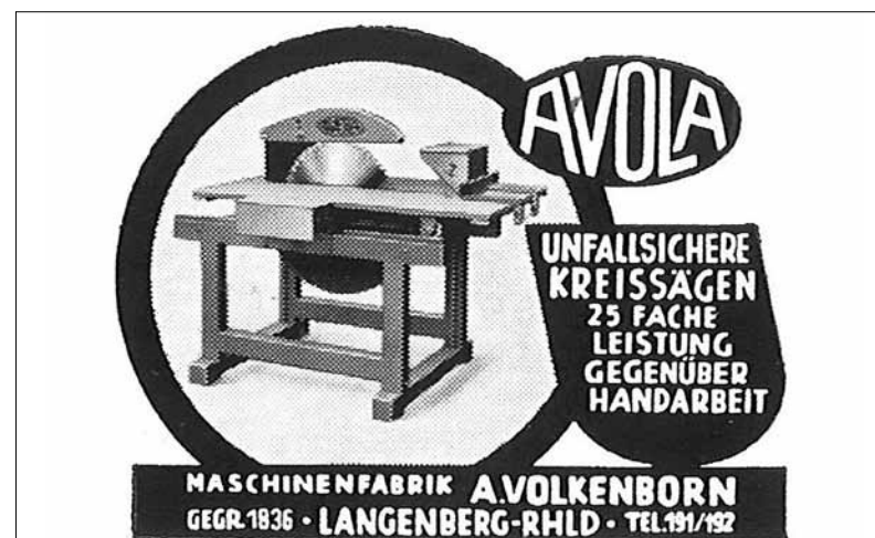
Historische AVOLA-Werbung zur unfallsicheren Kreissäge.