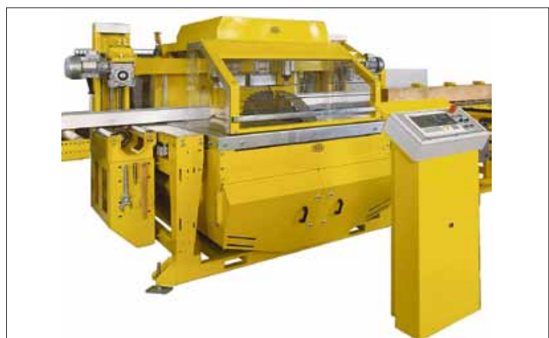
AVOLA-Zimmereikreissäge Gama 80 V 4 mit automatischer Be- und Entladung.