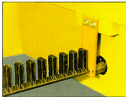
Zwischenstück mit Abreinigungsgestänge